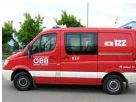
KEF Bahnhof Wolfurt